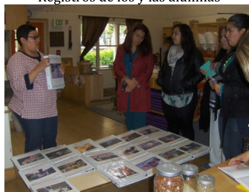
Figura 1 Registros de los y las alumnas

Se presenciaron nueve ponencias en torno al uso de la investigación-acción con el nivel preescolar, estas temáticas fueron diversas, entre ellas se habló sobre la transformación y el cambio a través de los procesos de investigación, la integración sensorial, el uso de la tecnología para el análisis de la práctica docente y análisis de videos, estimulación sensorial, apoyo a las escuelas a través de actividades en el museo, construyendo confianza y confort por medio de libros ilustrados, niños