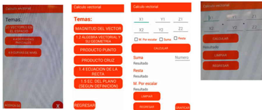
Figura 1. Menú principal, temas de la unidad I, operaciones con vectores y producto punto.

También la tecnología ha tenido una extraordinaria capacidad para registrar, obtener, almacenar y operar con datos discretos sobre la actividad de personas (Castañeda, 2019), y aunque no se controló un entorno en el que se pudiera videograbar al alumno para posteriormente ser analizado (Chung, 2019), sí se consideró que el empleo de teléfonos inteligentes pudiera mediar el objetivo docente. Los teléfonos inteligentes son objeto de desarrollo de contenidos educativos digitales que buscan incorporar elementos audiovisuales para ser más atractivos al ser consultados (Domínguez, Organista y López, 2018). Y al no contar con un equipo de diseño instruccional que procesara un análisis, diseño, desarrollo, implementación y evaluación de un recurso educativo (Domínguez, Organista y López, 2018), en nuestro estudio empleamos AppCalc , desarrollado por estudiantes del TecNM. En el periodo escolar II-2018 un equipo de estudiantes del tercer semestre de Ingeniería en Sistemas Computacionales y Mecatrónica desarrolló una app para Android que funcionó en cualquier tipo de dispositivo móvil a partir de la versión 4.4.4. La aplicación para celular AppCalc muestra un primer menú como se muestra en las figuras 1 y 2.