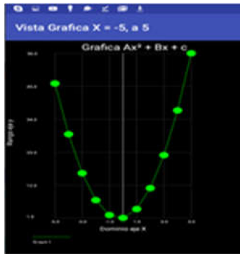
Figura 3. Se requiere que el alumno tabule puntos de una función cuadrática vista en cursos anteriores.

constatamos con demasiada frecuencia la falta de dominio de ellas en el nivel superior. Siguiendo la recomendación de Álvarez et al. (2008) de incluir a la par una sección de contextualización y problematización de los contenidos, a lo que denomina “pasar de un nivel 1 de contenidos a un nivel 2 de habilidades”, el curso de Cálculo Vectorial se presenta como una excelente oportunidad para seguir integrando los conocimientos básicos de aritmética y álgebra.