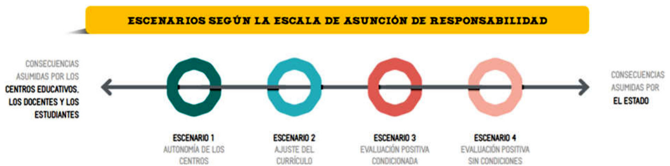
Figura 2. Cuatro escenarios o tipos de ajustes educativos realizados por las escuelas.